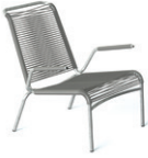
Modell 1142 Altorfer Lounge Sessel