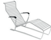
Modell 1096 Breuer Liege → S. 24