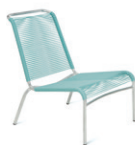
Modell 1139 Altorfer Lounge Stuhl → S. 22