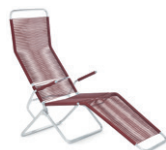
Modell 1158 Altorfer Liegestuhl → S. 20