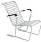
Modell 1090 Breuer Sessel → S. 25